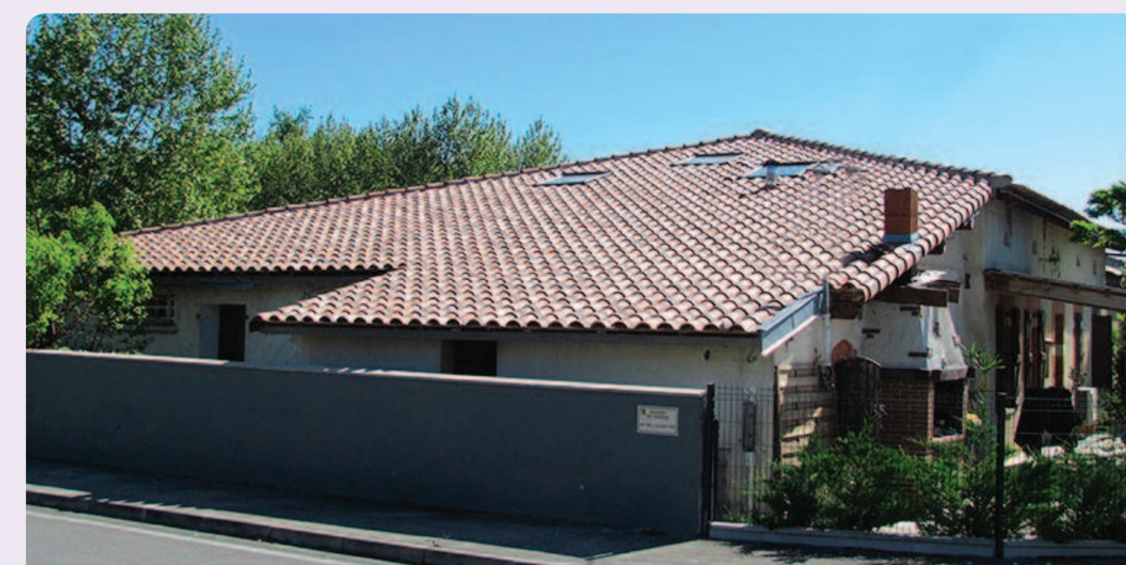
La maison de Vendine aujourd'hui

« Qui sauve une vie, sauve l'humanité ». Fidèles à cet adage du Talmud, de nombreux membres du réseau Saliège, qui ont œuvré pour le sauvetage des Juifs de France, sont reconnus « Justes parmi les nations »*.